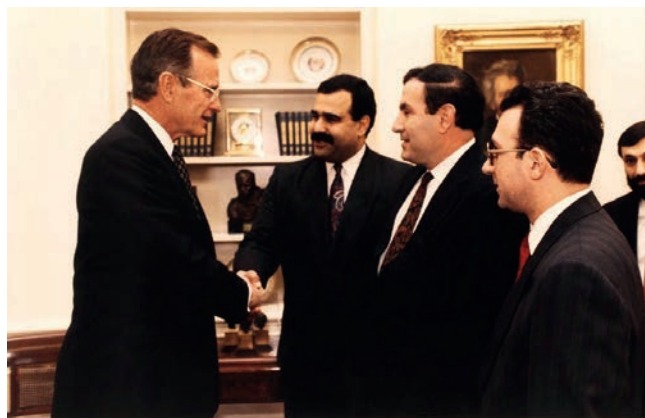
Raffi Hovannisian, then foreign minister of Armenia, shakes hands with U.S. President George W. Bush.

A few weeks later, in a private meeting at the presidential office, Ter-Petrosyan accepted my father's resignation. Overnight, my father became a dissident in the very republic he had spent his life dreaming about.*